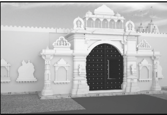
નવનિર્મિત મુખ્ય દરવાજો