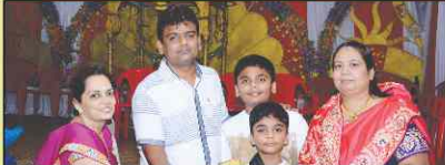
માતુશ્રી ભાવનાબેન અમિત મોમાયા પરિવાર