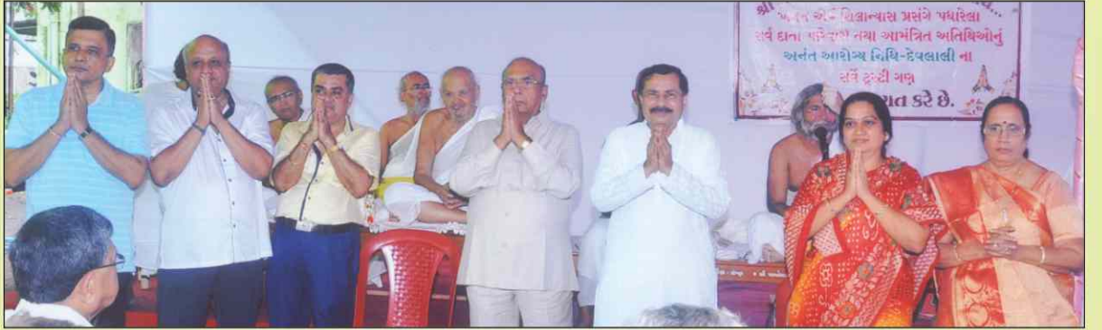
પૂજ્યશ્રીઓ સાથે શ્રી અનંત આરોગ્ય નિધીના ટ્રસ્ટીગણ