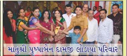
માતુશ્રી પુષ્પાબેન દામજી લોડાયા પરિવાર