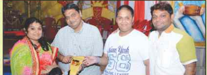
માતુશ્રી તરલાબેન તારાયંદ મોતા પરિવાર