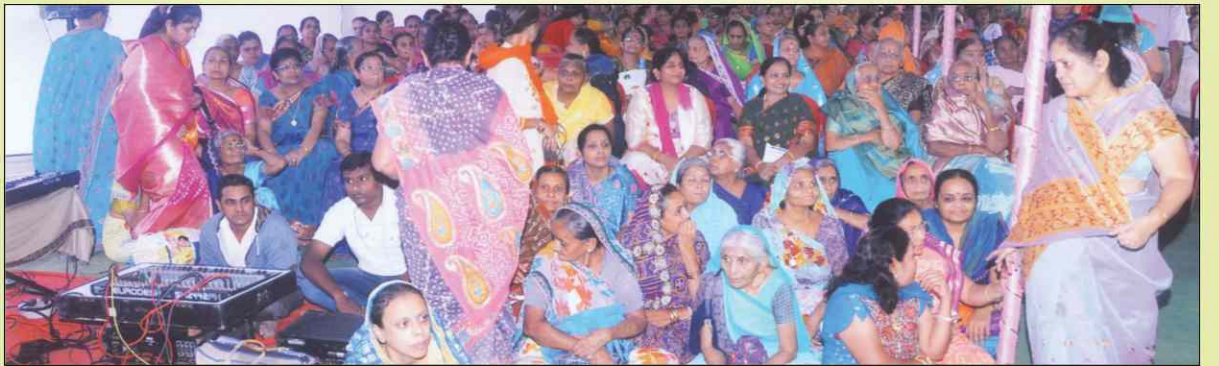
ભૂમિપૂજન તથા શિલાન્યાસના કાર્યક્રમમાં વિશાળ જન મેદની