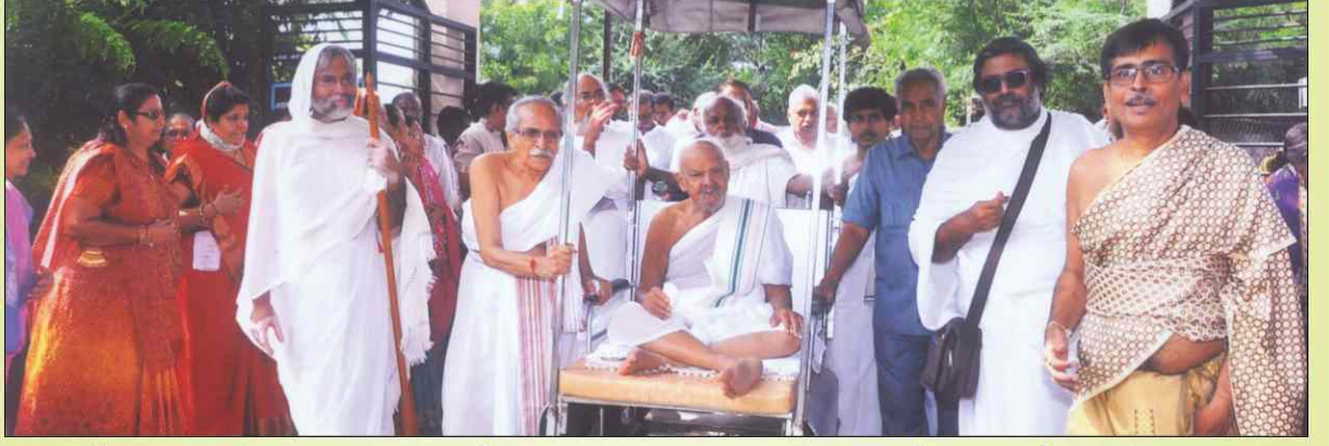
તપચક્રવર્તી અચલગરછાધિપતિ પ.પૂ.આ.ભ. ગુણોદયસાગરસૂરીશ્વરજી મ.સા. આદીકાણા સાથે અનંત આરોગ્ય નિધીમાં પાવન પગલાં